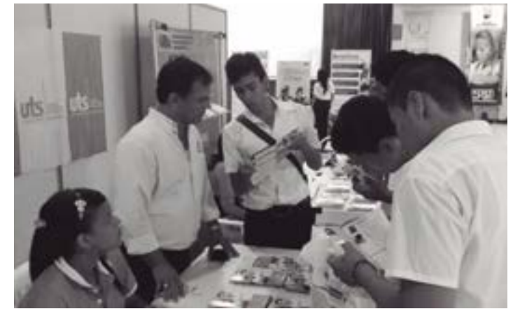
undécimo grado de los colegios públicos y privados del municipio.

Una de las fortalezas de nuestra institución, ha sido la posibilidad de inclusión de la comunidad a la educación superior, en el nivel de formación tecnológica. Así mismo la calidad de nuestros programas dan respuesta a las expectativas y necesidades de la región, tanto en el entorno industrial como en el socioeconómico. El stand de las UTS contó con la visita de más de 1500 de los estudiantes de